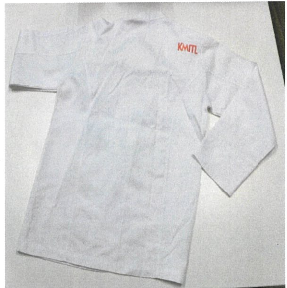
ด้านหลัง