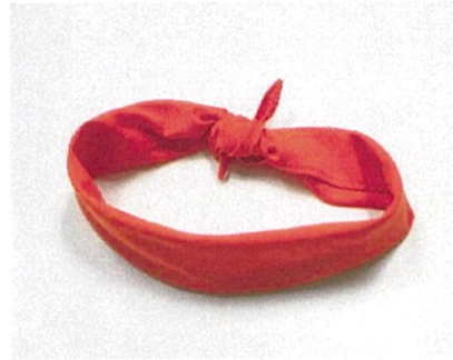
ผ้าผูกคอเชฟ